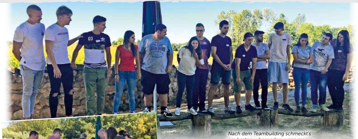
Nach dem Teambuilding schmeckt's am besten – besonders wenn man selbst gekocht hat.