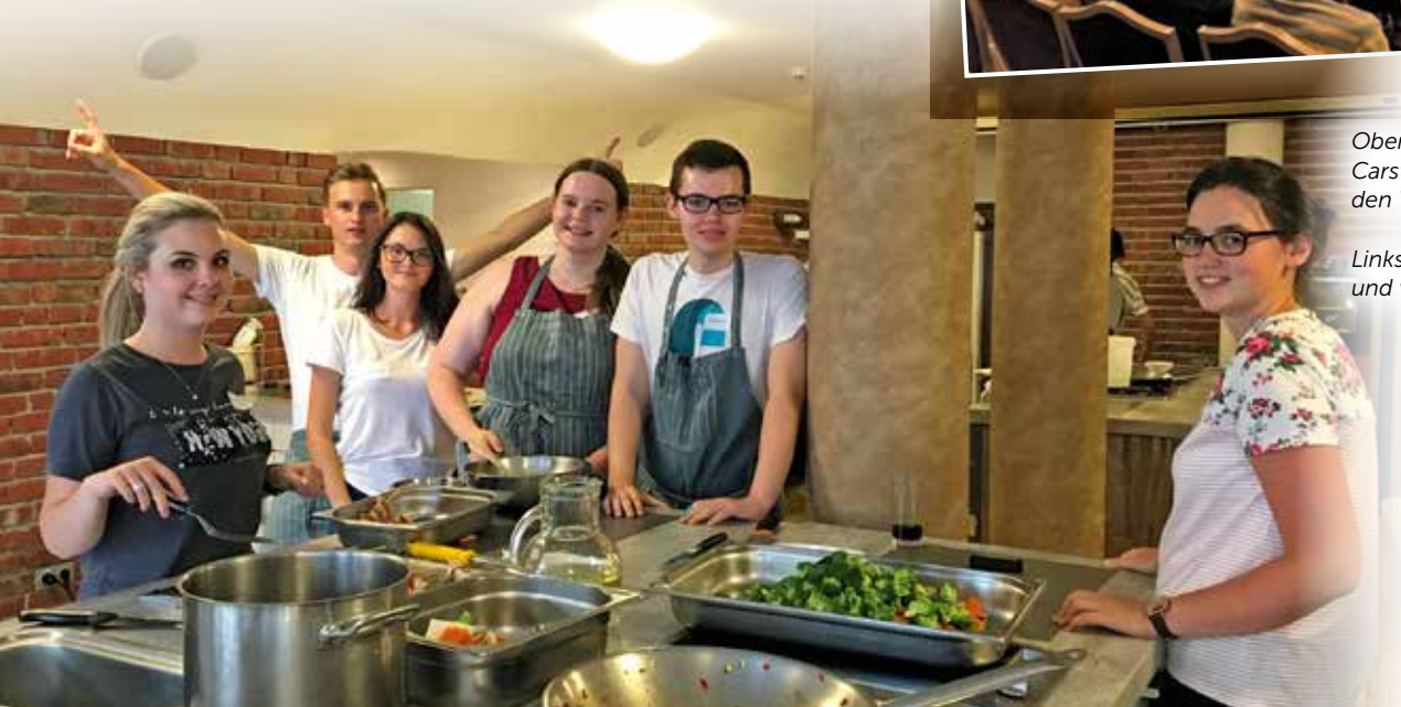
Links: Kochen macht Spaß und verbindet!